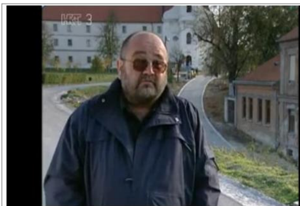
kulturna baština: Srednjovjekovne utvrde na Dunavu

Zdenko HTV3 - dokumentarni film „Srednjovjekovne utvrde na Dunavu“ (21. 07. 2015.) http://www.mojnet.com/video-kulturna-bastina-srednjovjekovne-utvrde-na-dunavu/b217335726a7755cc9a5